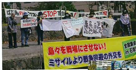
石垣島のミサイル基地化に反対する集会=3月5日

「戦争する国」づくりストップ、憲法守れ、の立場で共同する政党や自治体首長が登場。軍事同盟によらない平和を目指す国際連帯の場として、海外ゲストも発言します。鹿児島をはじめ九州・沖縄、さらに全国各地の基地強化や戦争準備の実態と、これを止める市民運動が一堂に会します!