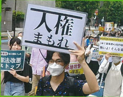
憲法いかせ!と訴えた若者憲法デモ=6月11日、東京都内

大軍拡・『戦争国家』づくりストップ! 軍事費を暮らしに回せ 憲法9条活かした平和外交で、非核平和のアジアを 国連憲章守れ! ロシアは侵略中止せよ! 一刻も早い停戦を