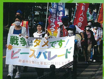
「戦争準備ではなく平和外交を」と訴えた ピースパレード=5月21日、東京・日野市