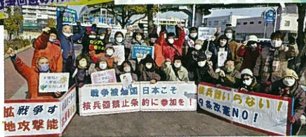
「大軍拡ストップを!」大きくアピール=1月7日、名古屋市