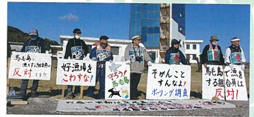
馬毛島・葉山港で基地建設中止を訴える人たち =2020年12月、鹿児島県西之表市

沖縄・九州で軍事基地・演習強化が激化しています。鹿児島では馬毛島の米軍・自衛隊基地化、奄美大島への敵基地攻撃部隊の配備、鹿屋基地への米軍無人偵察機の配備が進められ、住民が反対の声を上げています。鹿児島で行われる日本平和大会に「戦争準備やめろ!」の運動と思いを持ち寄りましょう。最終日はパレードも!